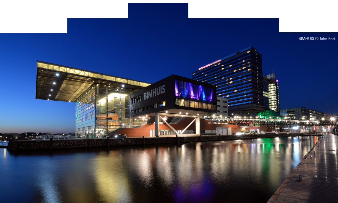
BIMHUIS

best clubs in the world', aldus Branford Marsalis. Het BIMHUIS scheidt een hechte band tussen musici, bezoekers en medewerkers. Het BIMHUIS richt zich in het bijzonder op in een vroeg stadium herkennen, stimuleren en presenteren van excellent talent. Het is partner in tal van (inter-)nationale samenwerkingsverbanden en aanjager van internationale netwerken. Randprogrammering zorgt voor verdieping en verbreding van publiekservaring. We programmeren steeds met publieksoontwikkeling in gedachten. We programmeren voor zowel de beginnende luisteraar als de gevorderde liefhebber.