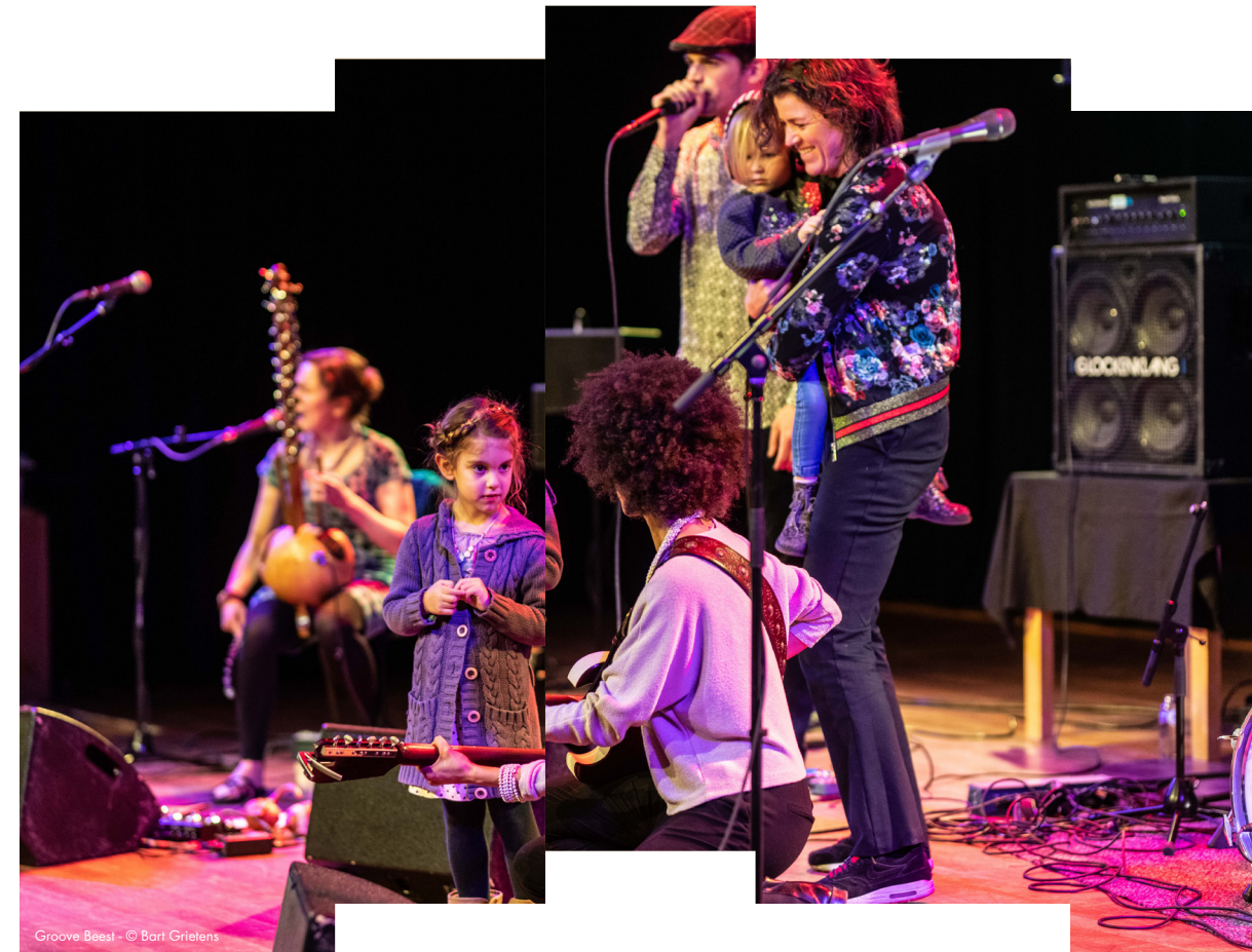
Groove Beast!

In het seizoen 2019-2020 startte BIMHUIS met Groove Beast! -een serie jazzconcerten voor scholen en families. Het BIMHUIS geeft met Groove Beast! bands de kans om een educatief concert vorm te geven in samenwerking met het ervaren educatieteam van het Muziekgebouw/ BIMHUIS. De musici kunnen ervaring opdoen en zich op dit terrein ontwikkelen. De bands behoren tot de nieuwe lichtung