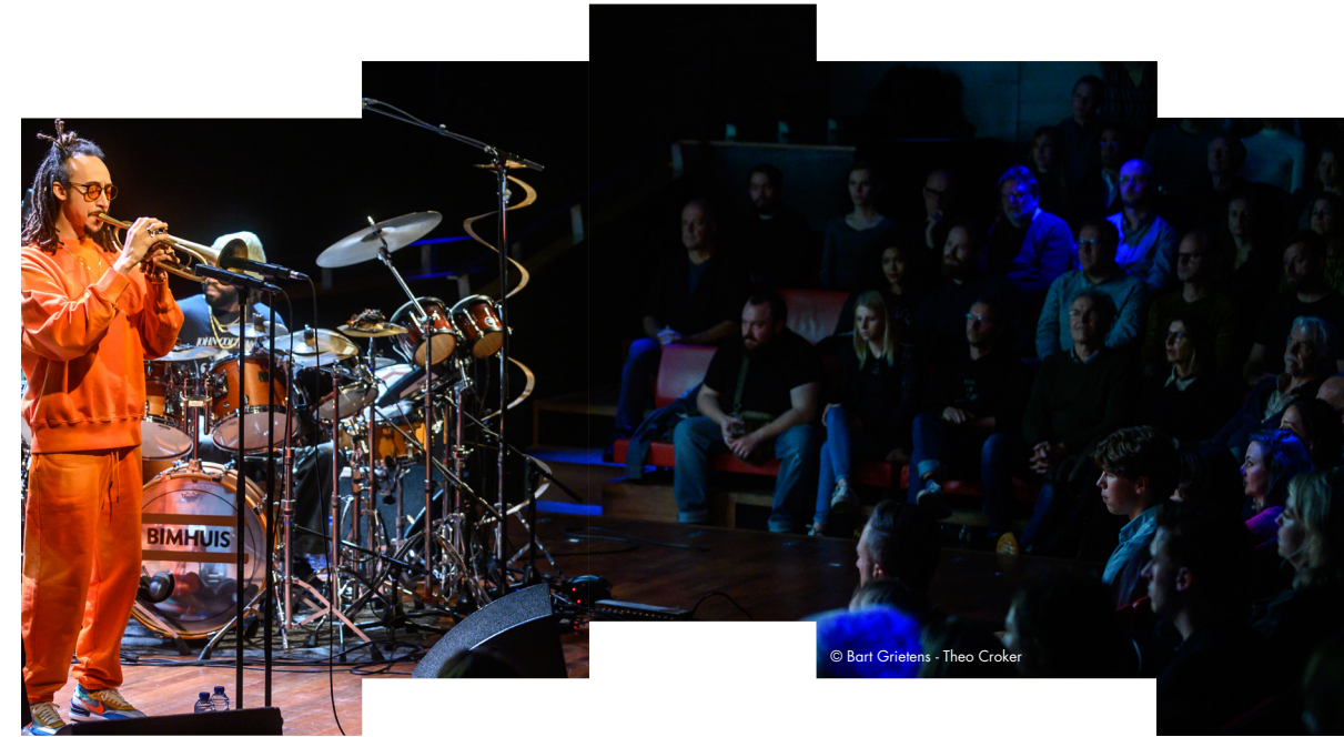
Theo Croker