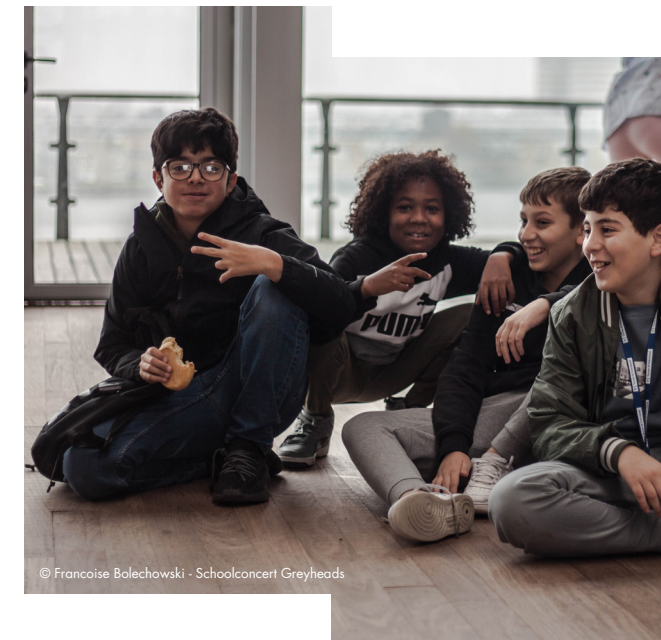
Schoolconcert Greyheads

Vanaf 2021 is een langdurige samenwerking met Stichting De Vrolijkheid gestart. De komende drie jaar zetten we ons samen in voor het organiseren van workshopreeksen op verschillende