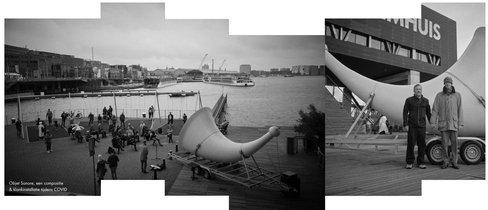
Objet Sonore, een compositie & klankinstallatie tijdens COVID