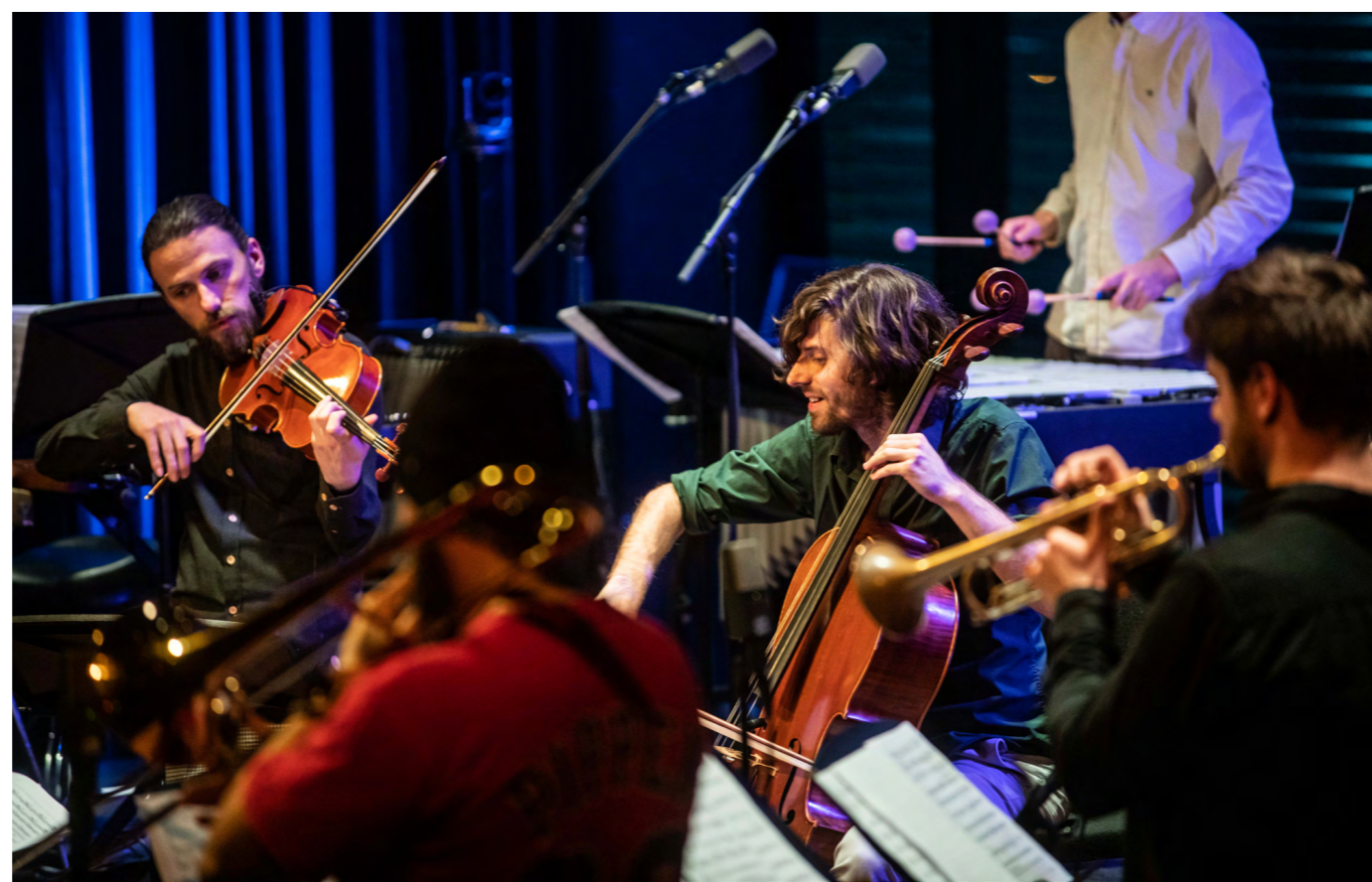
Tijn Wybenga & AM.OK © Bart Grietens BIMHUIS TV

NRC over compositie opdracht Ben van Gelder, 2019