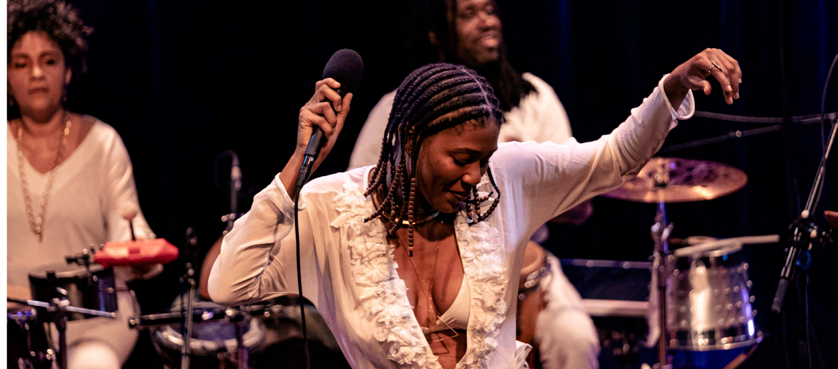
Luedji Luna