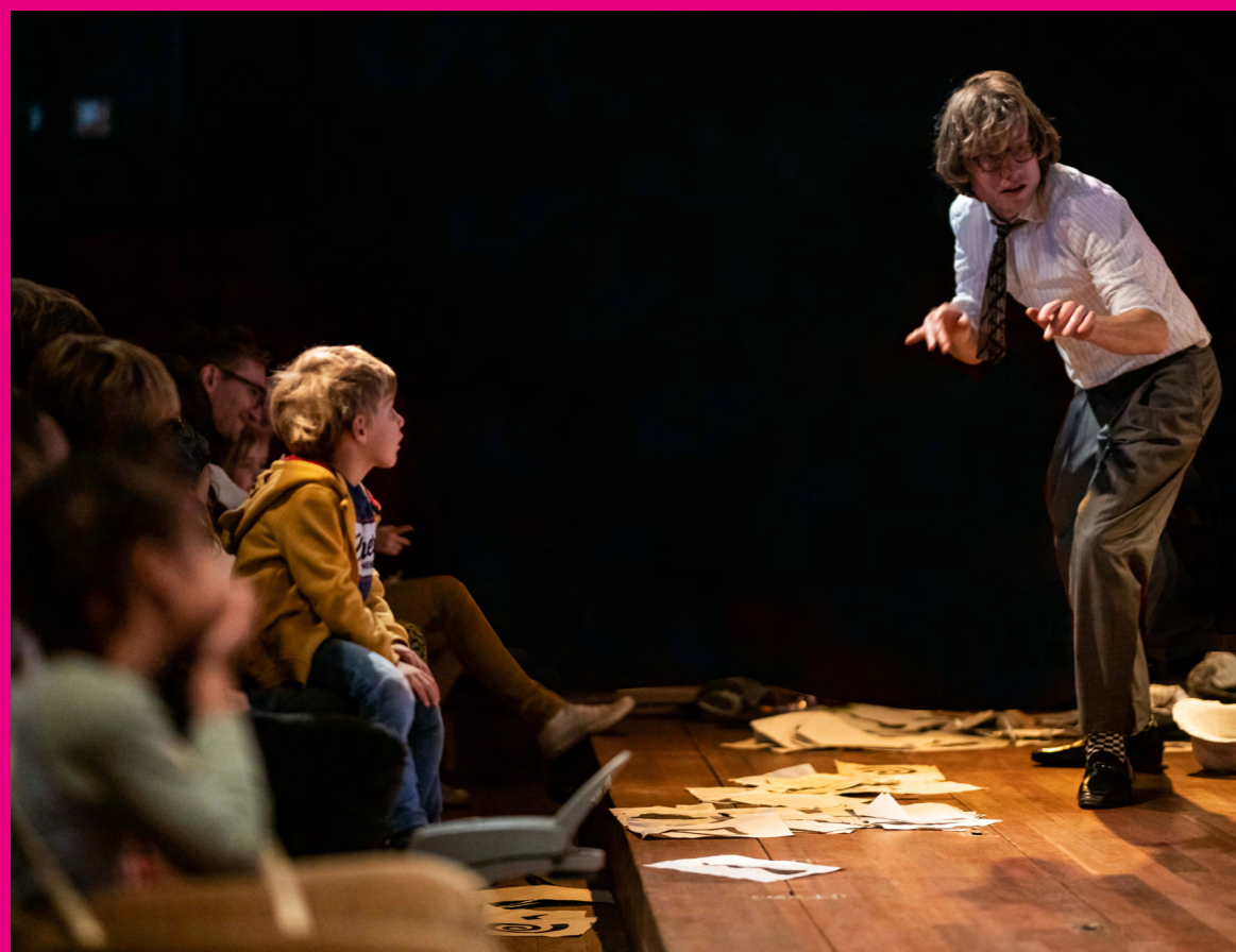
Familieconcert Thelonious