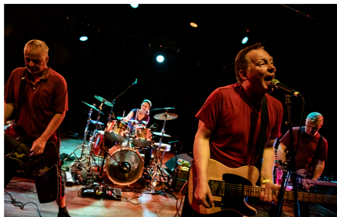
The Ex - 40 years © Maarten Mooijman

Met Amsterdam Roots gaan we sinds 2019 op zoek naar musici die zich laten inspireren door hun vaak gemengde roots. Afrikaanse muziek, maar ook Braziliaans, Latin en Turks. We werken samen tijdens het festival en Roots programmeert daarnaast twee concerten per jaar: lokale,