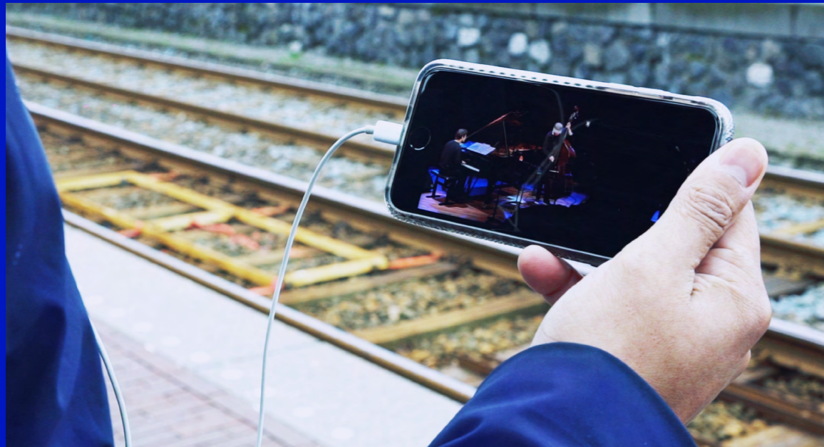
BIMHUIS TV