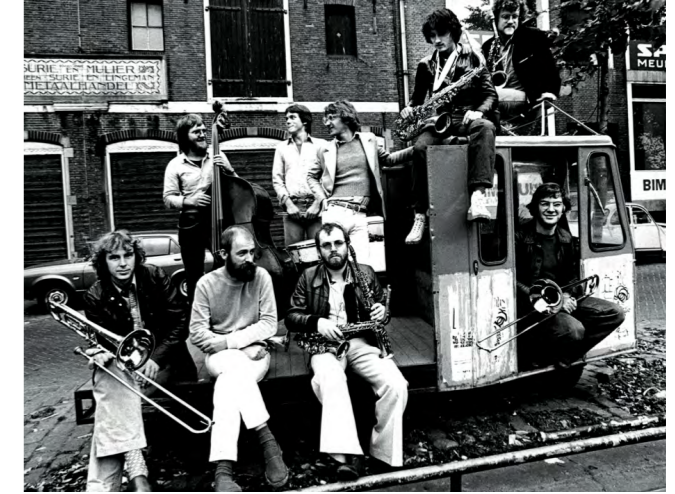
Het Willem Breuker Kollektief voor het oude BIMHUIS

Het BIMHUIS brengt als internationaal jazzpodium het beste van de wereld naar Amsterdam: jaarlijks ruim 25 grote namen, waarvan er enkele het beste passen in de grote zaal van het Muziekgebouw (John Scofield, Joshua Redman, Brad Mehldau). We programmeren musici die het geluid van de toekomst brengen (internationale subtop) en een jong publiek aanspreken (Ambrose Akinmusire, Becca Stevens en Bill Laurance). Daar horen